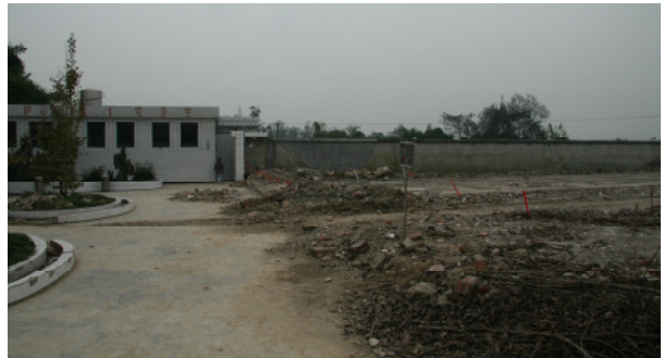
隆兴镇中心幼儿园震后残貌