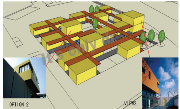
Virtuarch 绘制的拟在四川建设的学校草图，可容纳 400 名学生

位置：崇州市，隆兴镇 损坏程度：所有教室均已在地震中倒塌 规模：可容纳 300 至 400 名学生 面积（平方米）：6800 所需设施：8 间教室