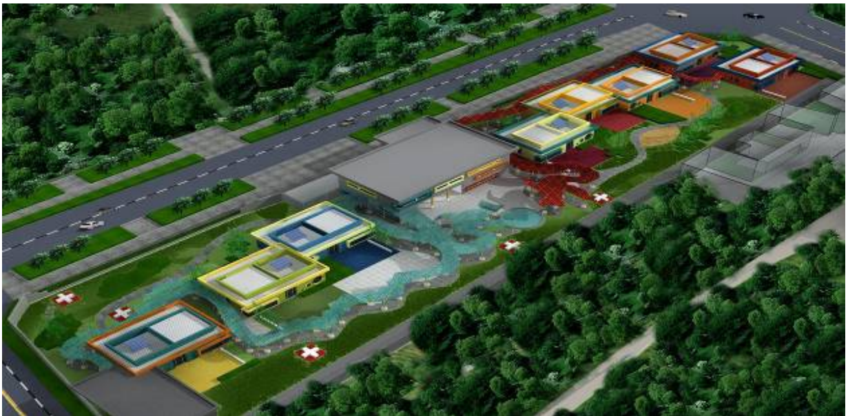
崇州隆兴学校的鸟瞰图

为了给孩子创造一种在行走中学习和探索的环境，受到传统中国园林的启发，德建采用了游龙形走廊把整个校园区分成几个区域。在形似游龙的红蓝走廊的引导下，孩子们将被引导到各自的教室，由于每个教室的外墙都有不同的颜色和不同的动物，孩子们可以很容易地找到教室。