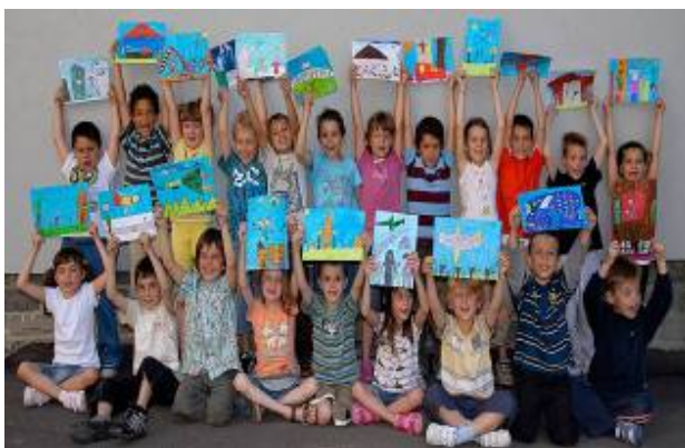
瑞士课堂中学生手举绘画的照片

通过发送电子邮件到以下地址，您可以立即订购月历： info@sha.swisscham.org