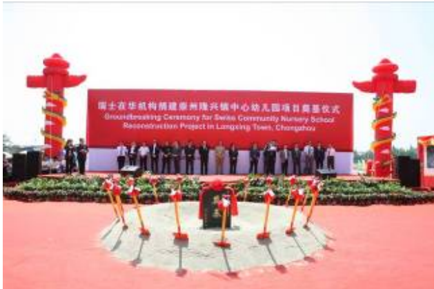
2009年5月隆兴镇举行奠基仪式

2009年5月20日,项目奠基典礼成功举行。瑞士驻华大使、上海瑞士商会副主席、北京瑞士商会董事、崇州市市长等当地政府领导和捐赠公司代表等出席了活动。共有12家全国和地方媒体对此事进行了报道,网络转载达到40多篇。