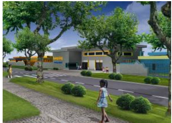
崇州隆兴学校北入口

该幼儿园的教室正是借鉴了瑞士及当地农村和小镇的风貌，概念设计的目的是为了将学校融入周围现有的环境，使其成为今后几年隆兴镇重建项目的一个亮点。用快速成长的竹子作为绿化并作为走廊的建筑材料，充分考虑了环保和可持续发展的因素。