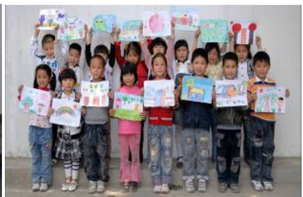
中国隆兴镇课堂中学生手举绘画的照片