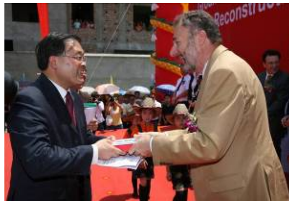
瑞士代表团与隆兴镇代表们交换礼物

瑞士及当地农村和小镇的风貌。用速生竹子作为绿植和走廊的建筑材料，表现了该项目充分考虑到了环保和可持续发展的因素。