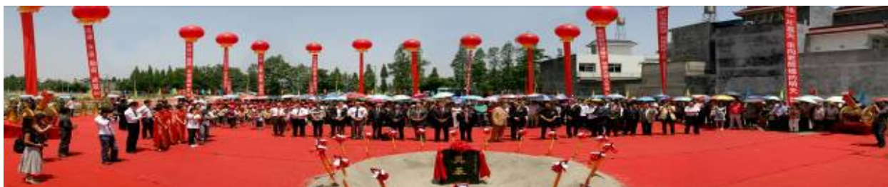
2009 年 5 月 20 日隆兴镇举行奠基仪式

瑞士驻华大使 Blaise Godet 先生说：“上次访问时，我发现隆兴的孩子们在临时教室里学习，他们的学习条件非常艰苦，但他们的活力和热情让我深受感动。这促使我们加快了学校重建的步伐。上次，我站在这块土地上，表示要与中国政府一道为灾区的长期重建和恢复提供持久的支持和帮助；今天，这个项目中设计的两条为幼儿园孩子们提供庇护和欢乐的龙，就象征着我当时的愿望。除了这个安全、舒适、色彩美丽和现代化的学校之外，我们还将组织相互交流活动，为中瑞两国的儿童创造交流的机会。这个示范幼儿园将成为中瑞两国人民协作的标志和典范，它将使两国人民相互学习、相互帮助。我们还计划为四川省的教师提供培训机会，让他们在假期前往北京和上海的国际化幼儿园学习，提高教学水平。”