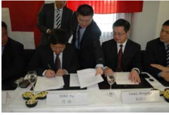
Bild 1: Xiao Xu, Oberstes Mitglied der Regierung von Shangrila und Yang Mingshu, Vize-Gouverneur der Provinz Diqing beim Unterschreiben des „Letter of Intent“