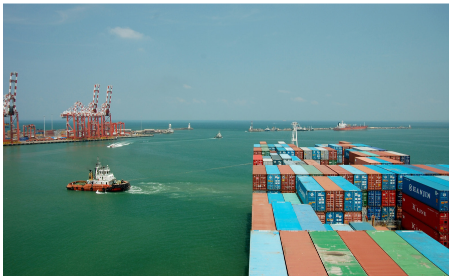
La construction d'une ville portuaire pour un montant de 1.4 milliards de dollars à Colombo, Sri Lanka, est un élément crucial de la stratégie chinoise « One Belt, One Road ».

Invoquant l'imagerie historique de l'ancienne route de la soie, l'OBOR prévoit la construction d'immenses chaînes d'infrastructures reliant la Chine au reste du monde. L'objectif est de renforcer les échanges commerciaux et d'améliorer la connectivité entre la Chine et l'Afrique, l'Eurasie, l'Europe, le Moyen-Orient ainsi que l'Asie du Sud et du Sud-Est. Si quelques parties de la nouvelle route de la soie sont déjà en place ou en cours de construction, l'essentiel du projet n'existe pour l'instant que sur le papier. Néanmoins, cette volonté de connectivité commence à capter l'attention de la communauté internationale. Les États, les entreprises ainsi que les citoyens susceptibles de se trouver sur les itinéraires proposés sont attirés par les moyens colossaux qui,