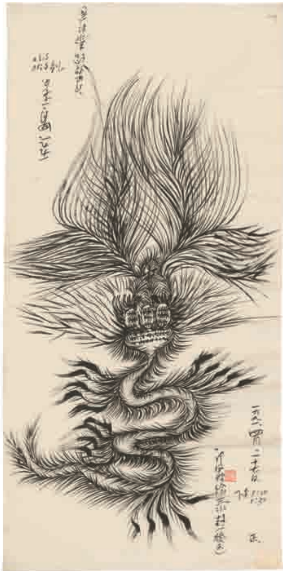
Guo Fengyi, La divination de Tai , 1991 encre de Chine sur papier, 135 x 65,5 cm Collection de l'Art Brut, Lausanne.