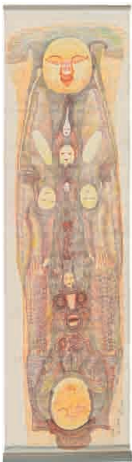
Guo Fengyi Le Mont Putuo , 1993 encre sur papier 153,5 x 52 cm Collection de l'Art Brut, Lausanne.

Les images sont disponibles sur le site www.artbrut.ch à la rubrique Médias > dossiers de presse. L'utilisation de ces images est limitée à la promotion de l'exposition Guo Fengyi . La légende des images doit obligatoirement être mentionnée.