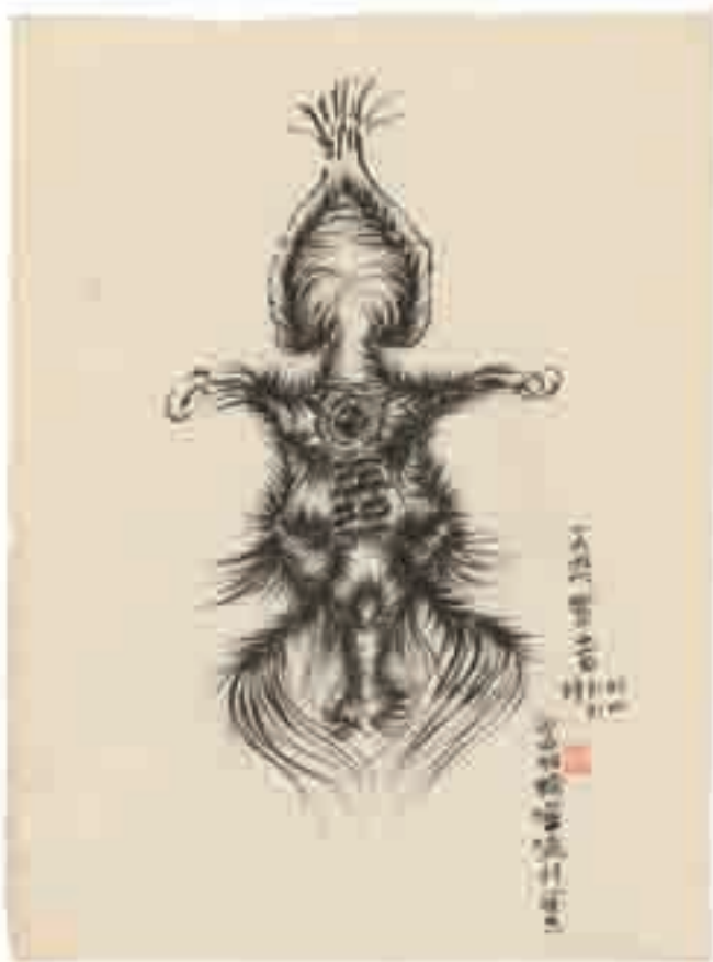
Guo Fengyi La divination de Shihe , 1991 encre de Chine sur papier 91 x 67,5 cm Collection de l'Art Brut, Lausanne.