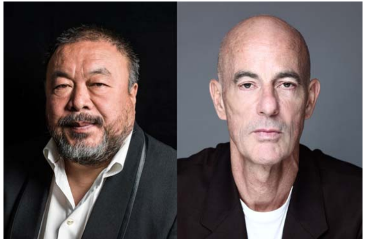
Ai Weiwei und Jacques Herzog