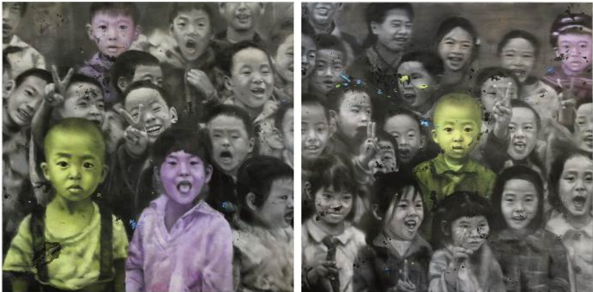
Li Tianbing, Ensemble # 1 + 2, 2008, Öl auf Leinwand, 2 Tafeln, 200 x 400 cm, © the artist. M+ Sigg Collection, Hong Kong. By donation

Zu sehen sind rund 150 Werke zeitgenössischer Kunst aus den letzten 15 Jahren. Neue Inhalte und Tendenzen zeichnen sich ab. Deshalb gliedert sich die Ausstellung in vier Themen, die zwei Bereichen zuzuordnen sind: Einerseits wird gezeigt, wie sich die chinesischen Künstlerinnen und Künstler eine künstlerische Position zwischen Westen und Osten sowie Fortschritt und Tradition erarbeiten («Globale Kunst aus China» und «Vom Umgang mit der Tradition»), und andererseits, wie die Auswirkungen des drastischen Wandels in China im Stadtraum, im Umgang mit Ressourcen, in der Dokumentation der jüngsten Geschichte sowie in der Persiflage des politischen Systems oder emotionalen Innenschauen zum Ausdruck kommen («Spuren des Wandels» und «Zwischen Konsumwahn und Spiritualität»).