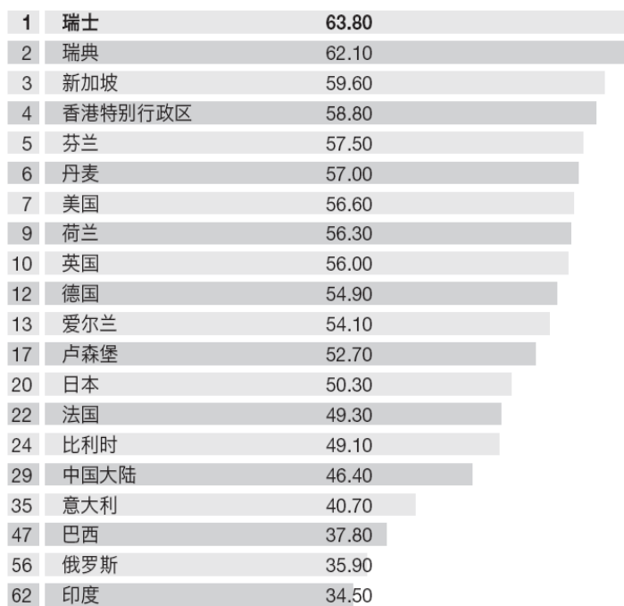
图 11: 2011年全球创新指数