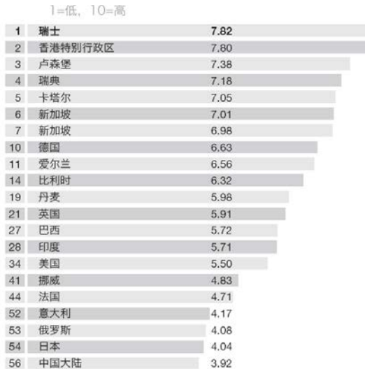
图 34: 国际经验 (2011)

正因为如此，大约 7000 家外资企业选择在瑞士开展业务，其中 1000 多家在瑞士设立了全球总部或地区总部。