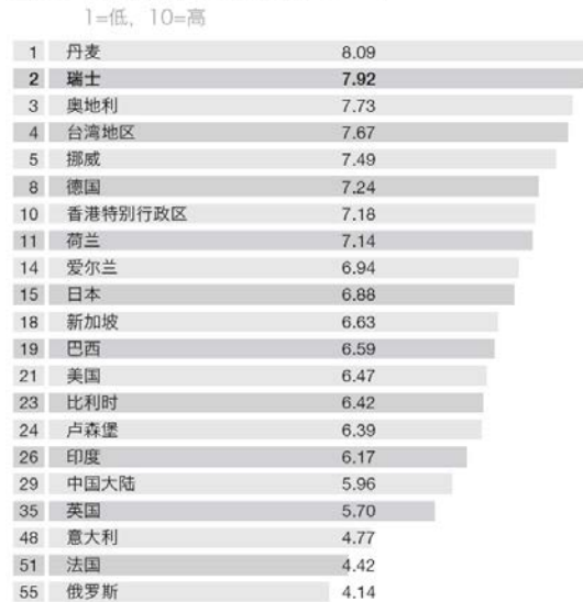
图 33: 劳动者积极性的国际比较, 2011年