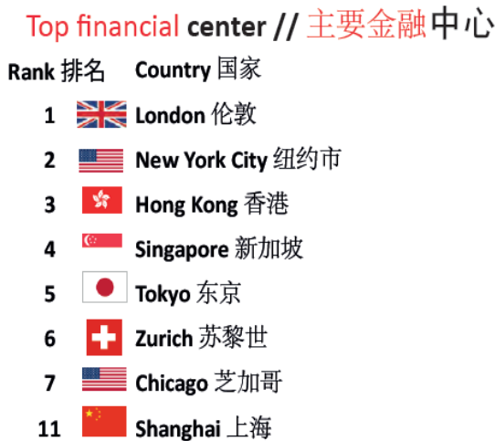
Global Financial Centers Index // 全球金融中心指数