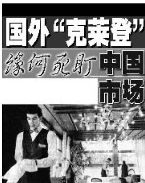
个别害群之马损坏了瑞士酒店管理学校的美好声誉 图 / 原载《新苏黎士报》