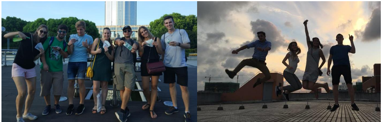
Einige der vorherigen Ausgaben Gewinner

Shanghai, 23. April 2018 – Schweizer Unternehmen und Institutionen unterstützen die Profis von morgen mit einem 2-monatigen Praktikum in China, innovativer und globaler Hauptdarsteller.