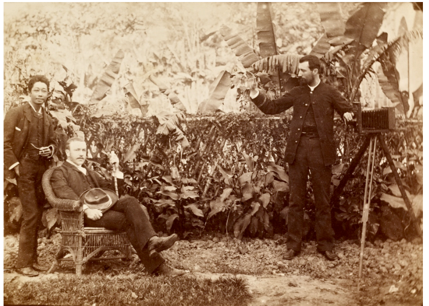
Photo prise à Hanoï en décembre 1887, en compagnie d'un prince siamois.

Ces illustrations peuvent être téléchargées sur le site www.unine.ch – Pour les médias – Communiqués de presse