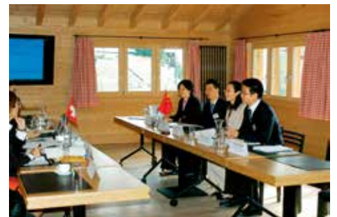
Réunion de travail d'un groupe sectoriel à Davos.

La restructuration du système économique chinois d'une économie planifiée vers une économie de marché socialiste, entamée à la fin des années 1970, a mené en 2001 à l'accession de la Chine à l'Organisation mondiale du commerce (OMC). Depuis, la Chine a commencé à conclure des accords de libre-échange, jusqu'à présent avec Hong Kong, Macao, Taïwan, le groupe de l'ASEAN 3 , le Chili, le Costa-Rica, la Nouvelle-Zélande, le Pakistan, le Pérou et Singapour. Des négociations sont en cours avec notamment l'Australie, le Conseil de coopération du Golfe (CCG), la Suisse et, depuis peu, avec la Corée du Sud et le Japon.