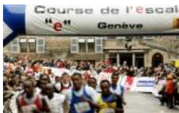
2008 年度第三十一届登城节赛跑 约有 26 000 多人参加。

举行的盛装游行活动。从 1978 年起, 又组织了登城节赛跑 (COURSE DE L'ESCALADE)。除庆祝活动外, 在登城节前后, 日内瓦市民要喝传统的菜汤, 吃用巧克力做成的汤锅。喝菜汤为了纪念当时用一锅汤, 第一个向登城敌人头上砸下去的华瑶姆大婶 (MERE ROYAUME)。而用巧克力做汤锅则是在 1870 年日内瓦甜品师的创新发明, 至今流传。成为届时日内瓦家家户户的节日食品。