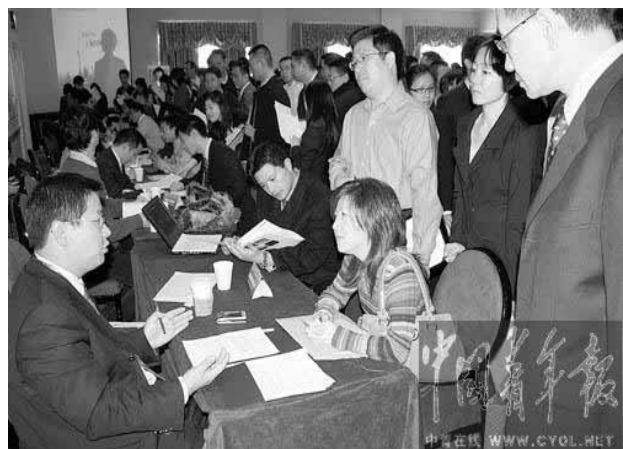
12 月 13 日, 上海市招聘高层次金融人才工作团在美国纽约举办人才交流会, 遭遇“爆棚”。

美国全国学院及雇主联合会日前对全国各行业雇主明年招聘计划抽样调查显示, 一半以上雇主表示 2009 年会减少招聘毕业生。除政府部门工作没有明显减少外, 农业、建筑业、贸易、物流行业雇佣人数均大幅度削减。