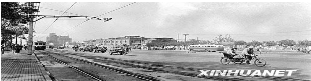
1958年10月北京西长安街街景（今西单附近）。