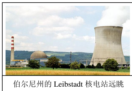
伯尔尼州的Leibstadt核电站远眺

瑞士目前共有五个核电站：即在阿尔高州(Argovie)的Beznau一期电站(1969年运营), Beznau二期电站(1971年运营), 在伯尔尼州的Mühleberg电站(1972年运营), 在索洛图恩州(Soleure)的Gösgen电站(1979年运营)和在阿尔高州(Argovie)的Leibstadt.电站(1984年运营)。一般地说,一个核电站的正常使用寿命约50年。因此,瑞士联邦政府决定在该五个核电站正常使用寿命到期时停止运营,同时不再建立任何新核电站。按照这个决定,瑞士将在：