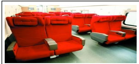
图为车厢内景,一排 4 座红色座套。每个坐椅上方设有阅读灯,窗帘为上下拉动。坐椅可以调整倾斜度。