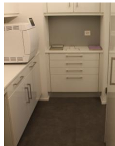
程序严格的消毒室