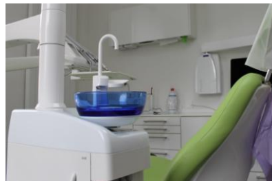
现代一流设备的治疗室 (1)