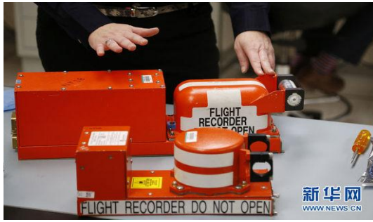
图为美国国家运输安全委员会的航空工程师介绍飞行记录器。