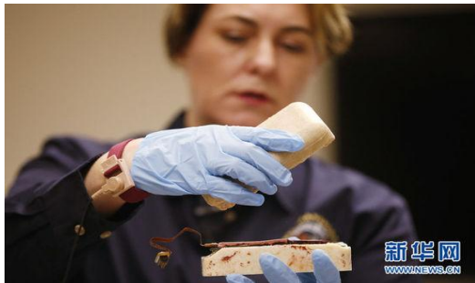
图为分解开的飞行记录器。